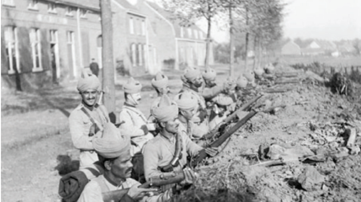
Sikhiska soldater (från Indiska Punjab) i det brittiska "129th Duke of Connaught's Own Baluchis". Bilden föreställer barrikader i utkanten Wytschaete i Belgien, oktober 1914. Husraden bakom dem visar hur nära bebyggelsen fronten gick. När de indiska trupperna anlände till västfronten sås det att de "räddade det brittiska imperiet". Indiska trupper stred i alla stora slag under 1914 och 1915 innan de förflyttade till Mesopotamien vid slutet av 1915. Indiska soldater stred inte bara på Västfronten utan också i Gallipoli, Egypten, Palestina, Persien och Salonika.