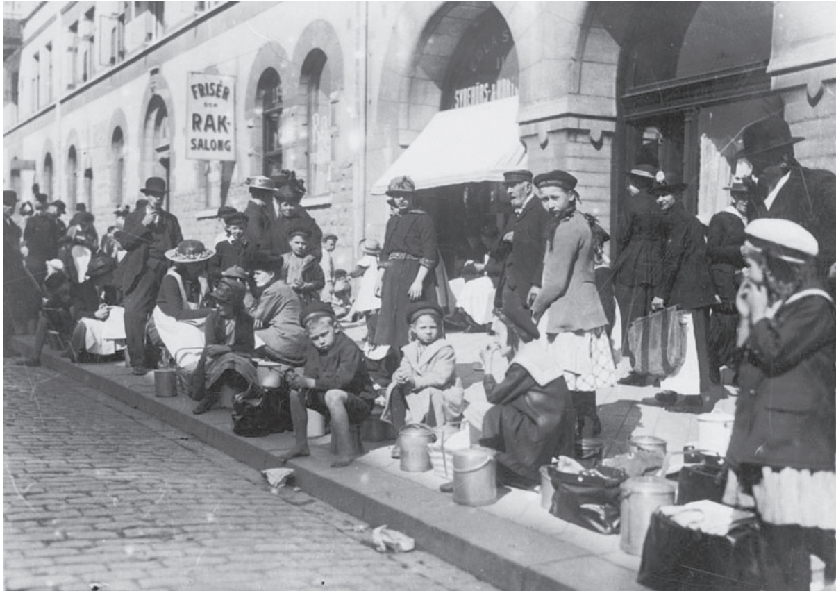
Bild 1. Under den första lektionen arbetade eleverna med frågan om hur Sverige påverkades av kriget. Bilden visar en kö till mathämtning på Hornsgatan under första världskriget p.g.a. ransoneringen.

nerna valdes för att de fungerade bra och var elevaktiva. Övningarna syftade till att öppna upp för ett interkulturellt perspektiv på första världskriget. Ni får också ta del av mina tankar kring de tre lektionerna, vad som fungerade och hur de kan utvecklas vidare. Lektionsupplägget i stora drag, finns i tabellform (tabell 1) i slutet av artikeln. Frågor om bedömning kommer inte att tas upp i artikeln.